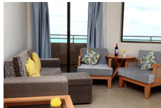
JUNIOR SUITE VUE SUR LA MER