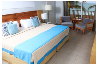
DOUBLE CAYO VUE SUR LA MER