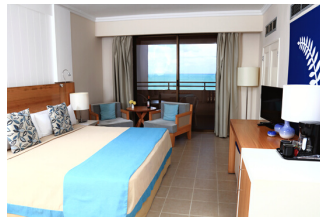
DOUBLE VUE SUR LA MER